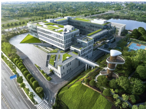
图1 湖南东方红科技创新中心（鸟瞰图）

在我看来，要解答这一命题，核心是完成一次有效的文化转译——把东方古典园林里“步移景异”的空间叙事智慧，以及“身心俱游”的审美体验，转化为现代建筑能读懂的语言。我们为这个项目设计了一套清晰的转译路径：以“起承转合”为结构骨架，串联“门、庭、巷、院、园”的空间序列；同时以建筑现象学为指引，把材料质感、光线变化、声音渗透这些元素当“词汇”，编排了一套能调动全身心感知的体验剧本。