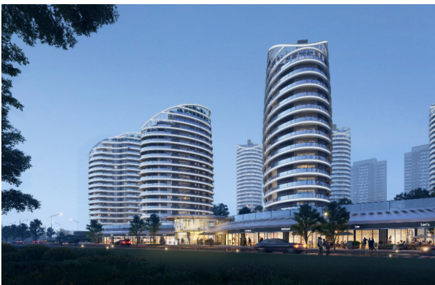
图2 人视角度效果图