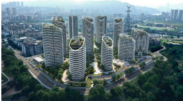
图 3 宜宾丽雅和锦效果图