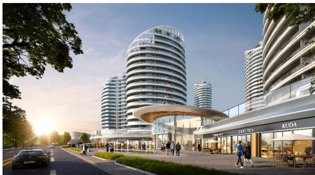
图 5 社区公共空间

共生。“风雨连廊”连通的各庭院,有机结合邻里,在促进人车分流的同时,促进交流,使小区环境更安全,四通八达的花园成为居民的自在花园。