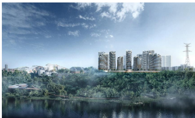
图 4 周边环境(入口远视)

“生态融合”是本项目可持续设计的核心策略之一,旨在打破建筑与自然的界限,营造共生体系。首先,在空间构型上该项目出入口设置沿江滨江上,打破钢筋水泥森林,入口有明显轴线布局,沿江景色引入内部空间,从小区内部可以饱览岷江美景(图 4)。科学合理营造的绿地景观系统,以中心绿地为核心,宅旁绿地与道路绿化为网,构建了层次分明、内外连通的三级绿地系统,有效提升社区绿化覆盖率和生态连通度。其次,在场地铺装采用透水混凝土、植草砖等透水材料;设集水花园,结合雨水收集系统,年雨水利用率可达 25%,防止积水,雨水收集后用于清扫、绿地浇灌、水景等;屋顶花园增加绿化面积,改善建筑第五立面,同时起到隔热降温作用。绿色屋顶的防水、承重、排水系统经过精密计算,避免渗漏和结构的失衡;建筑围护结构严格执行高标准节能设计,热工性能按照 65% 节能标准设计,采用保温倒置式屋面保温系统,倒置式屋面采用 60 厚挤塑聚苯板(XPS)保温材料,防水等级 1 级,大幅降低能耗作用,这些措施共同作用。室外绿化选用易打理植物,室内盆栽合理配置,构成多层次复合生态结构,小区绿化率达 30%,缓解城市热岛效应,实现了生态效益与景观效果的统一。