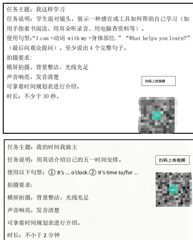
图3 视频作业布置图

当一个孩子用英语介绍自己亲手制作或喜爱的东西时，他体验的不是“做作业”，而是“用英语做一件属于我的事”。