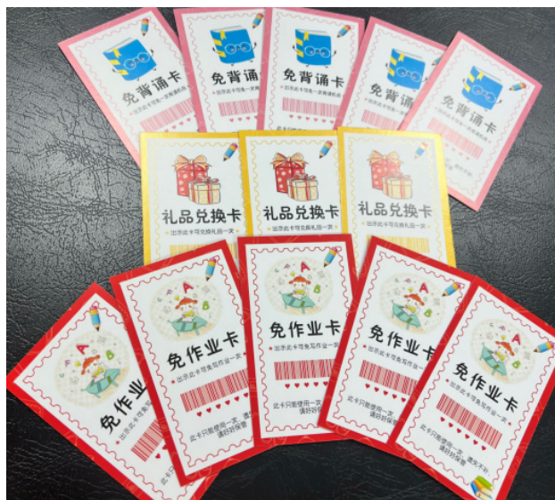
图4 印章兑换权限卡

此法则的核心不是“印章”或“存折”这些具体载体，而是“行为—标记—积累—达成”这一闭环结构。任何能够实现即时记录、可视积累、周期兑现的工具均可替代使用。