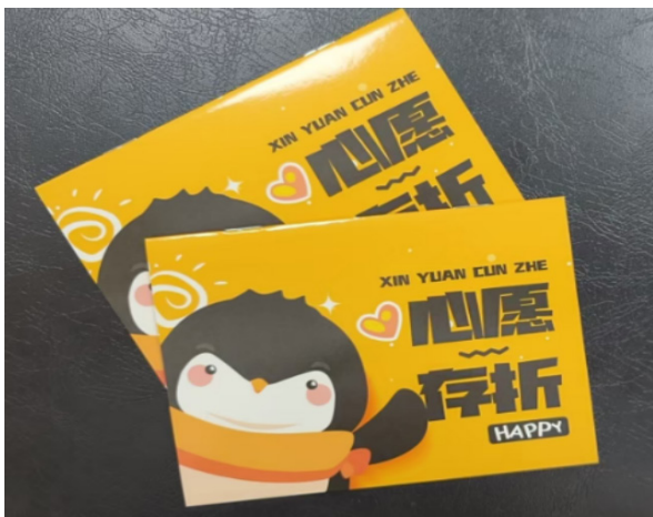
图 1 英语心愿存折

印章本身没有魔力,魔力在于它让一个孩子在一天结束时可以翻开存折,“看到”自己今天做到了什么。