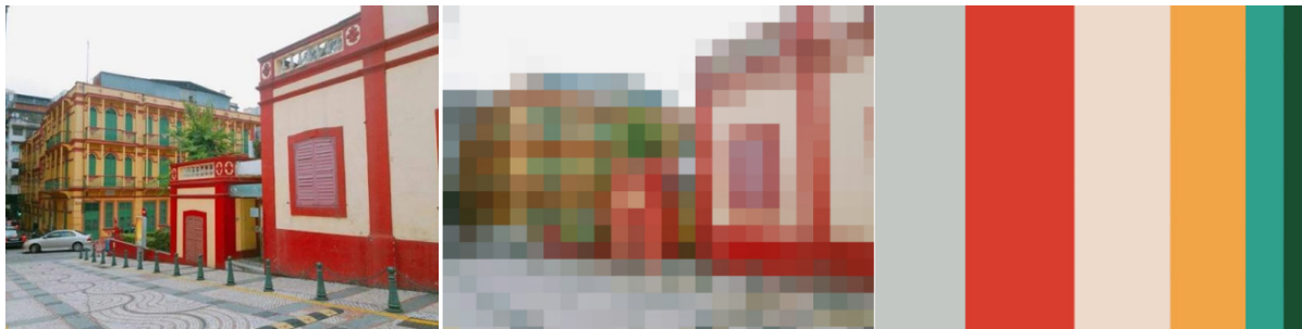
图 1 疯堂斜巷街道建筑色彩分析

如图 1 所示,通过将疯堂斜巷照片进行马赛克,计算每种颜色占据的比例绘制出颜色比例图,将这张色块图分别给十个不同的人看,问他们对于这个色彩图的感觉,最后得到人们对于疯堂斜巷色彩的直观感受:鲜艳、热烈、浪漫、浓郁、欢快等。这就是人们抛开对疯堂斜巷的认知、周围环境等因素对其视觉色彩最直观的感受。